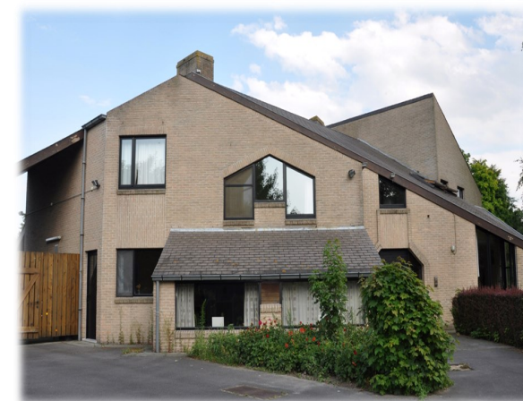
Centrum voor contextbegeleiding en verblijf